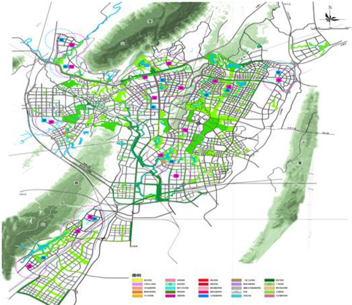
图3 西部职教基地2025年蓝绿系统与文化体育设施用地

产业布局：城东片区聚焦协同创新、科技成果转移转化，形成智慧科技生态城；城西片区助推永川现代制造业基地的建设，促进职教基地融入成渝科创走廊；城南片区提供优质的职业教育产教融合发展条件，积极推动大健康产业发展，打造集职教、医疗、养生、旅游于一体的职教融合区；城北片区以职教发展带动和促进创新创业，形成人景和谐的特色职教小镇。